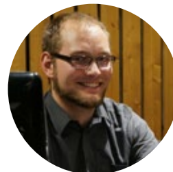
Technik, Licht, Ton David Sazinger

Mobil 0170 473 8603 d.sazinger@boeblingen.de